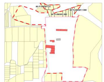
с. Жаворонки, М 1:10 000