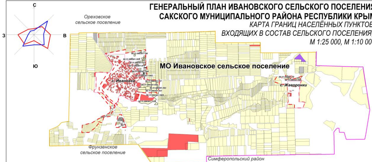
с. Ивановка, М 1:10 000